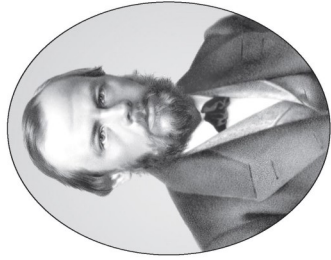
Фёдор Михайлович Достоевский. Литогравюра Ф. Бореля. 1862 г.

ПРОВОДНИК: Особенно ярко это проявляется в знаменитом романе «Преступление и наказание». Фёдор Михайлович с поразительной точностью описывает различные трагические события, связанные с лицом студента Родиона Раскольникова: Сенная площадь, узкие улочки, тёмные, сырые переулки, живописные, зачастую гнетущие набережные каналов, мосты, соединяющие берега, отдельные дома. Всё это становится неотъемлемой частью