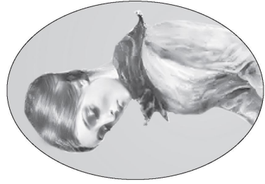
Соня Мармеладова. Иллюстрация П. Боклевского. 1880-е гг.

КУРАТОР: Всего в нескольких шагах от пристанища Раскольников находится дом, где в квартире № 9, принадлежавшей портному Капернумову, снимала комнату Соня Мармеладова — самая душевная героиня. Как мы знаем из романа, 18-летняя девушка