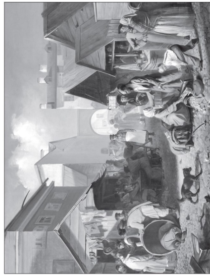
Общественный ряд в Петербурге. Художник А. Волков. 1858 г.

На этой площади Раскольников стал свидетелем трагической гибели Семёна Захаровича Мармеладова, отца Сони. Примерный ответ. Мармеладов попал под копыта лошадей, везущих барскую карету. От полученных травм он скончался.