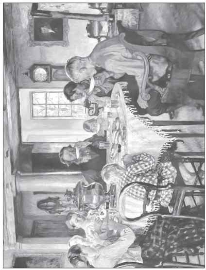
Новые хозяева. Чаепитие. Художник Н. Богданов-Бельский. 1913 г.

(Ребята рассматривают самовары, пробуют пить чай вприкуску)