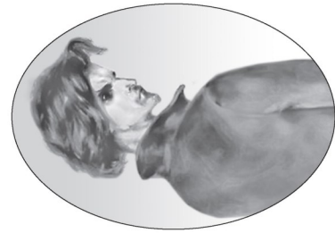
Родион Раскольников. Иллюстрация П. Боклевского. 1880-е гг.

СТАРШИЙ ДВОРНИК: Дерь добрый! По закону обязательно в квартирный договор включаются только цена и срок найма. Но имейте в виду, граждане жильцы, что категорически запрещается выпускать собак и кошек на лестницы, даже рожи и пианино дозволяется держать в квартире не иначе как с разрешения домовладельца. Арендаторам воспрещается превышать посторонним прениям, кроме той профессии, о которой было заявлено при найме квартиры. Если жилец, уходя из дома, имеет в виду возвратиться